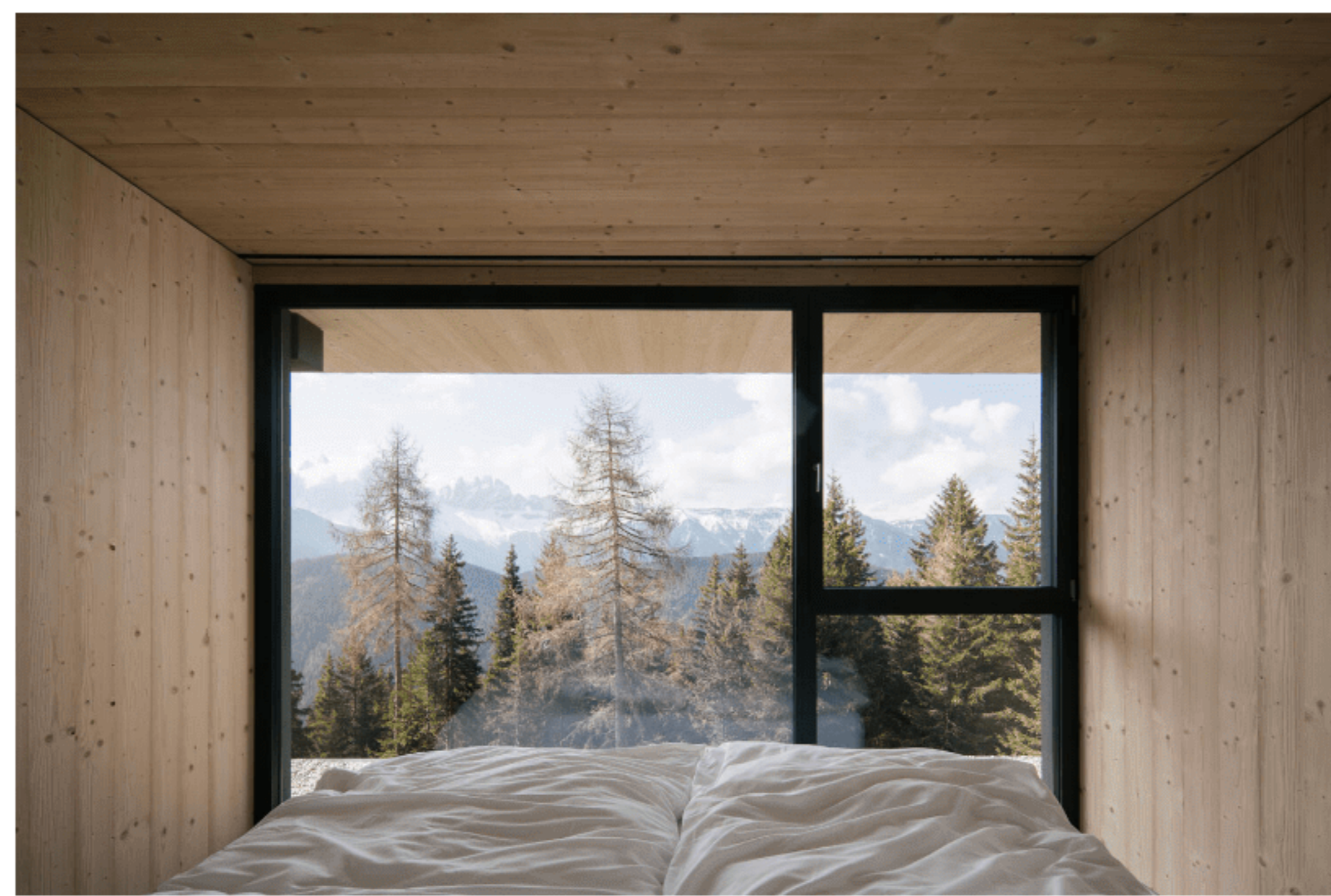
Vom Bett aus blickst du bis zu den Dolomiten.

Zwar erinnert die Außenfassade von Anders Mountain Suites aus gebürsteter Fichte ganz klar an das für die Region typische Bergchalet. Das flache Zementdach und die eckige Form verwandeln das Haus allerdings in einen modernen, schlichten Rückzugsort. Drinnen viel Fichte, Böden aus steingrauem Zement, dazu weiche Textilien und Stoffe. Liegst du im Bett und kuschelst dich in die weiße Bettwäsche, schaust du durch die raumhohen Fenster direkt auf die umliegenden Dolomiten.