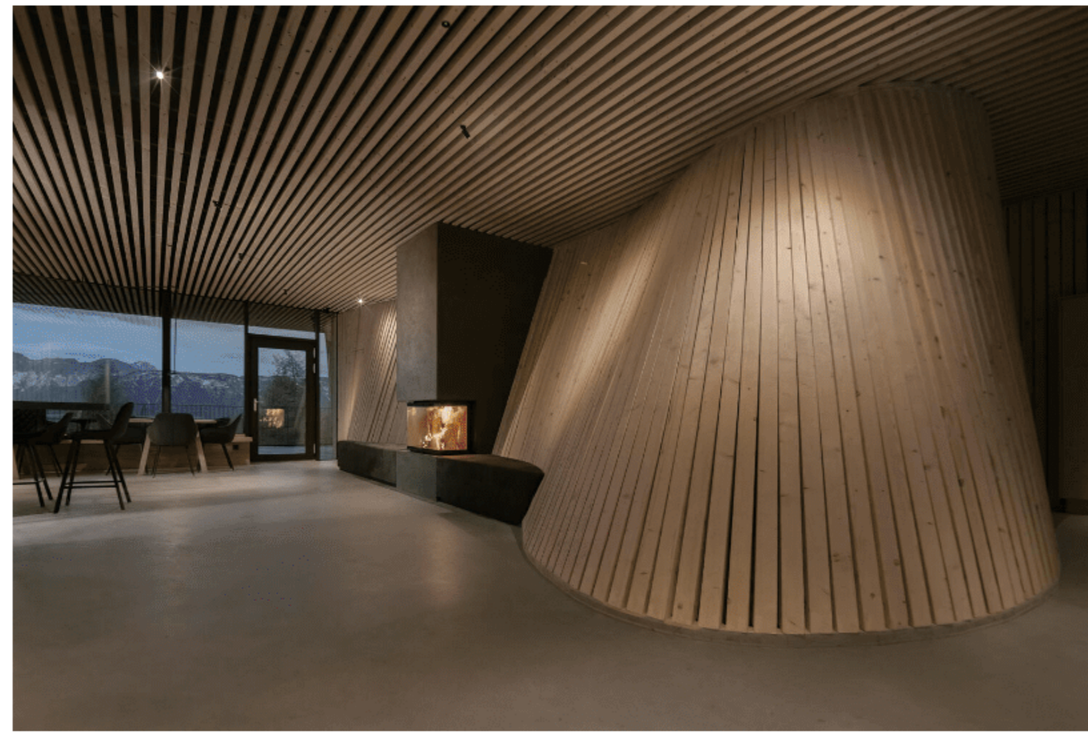
Am Kamin relaxen, ein Glas Wein trinken, die Aussicht genießen – der perfekte Tagesausklang.