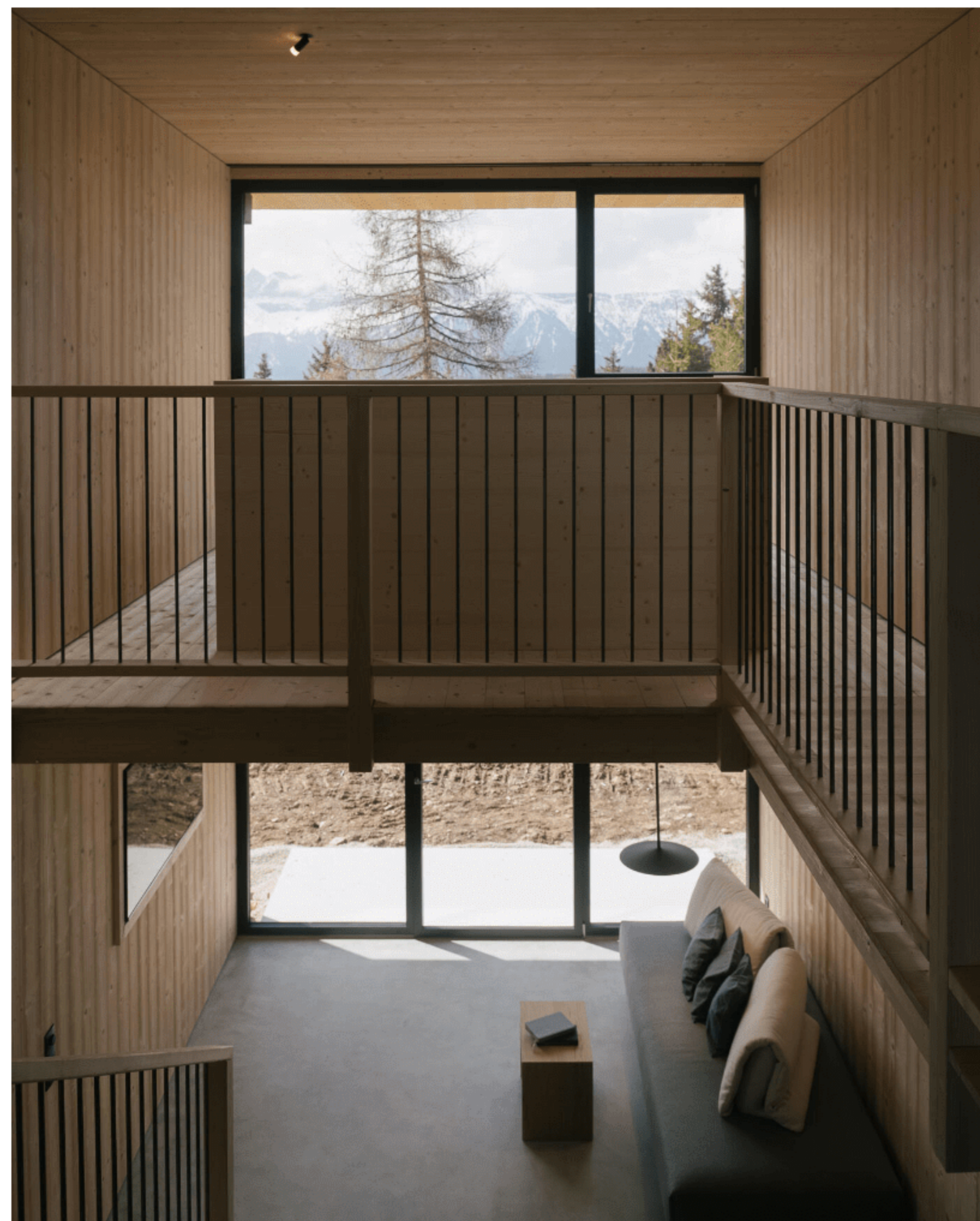
Hier kannst du dich auf zwei Stockwerke ausbreiten.