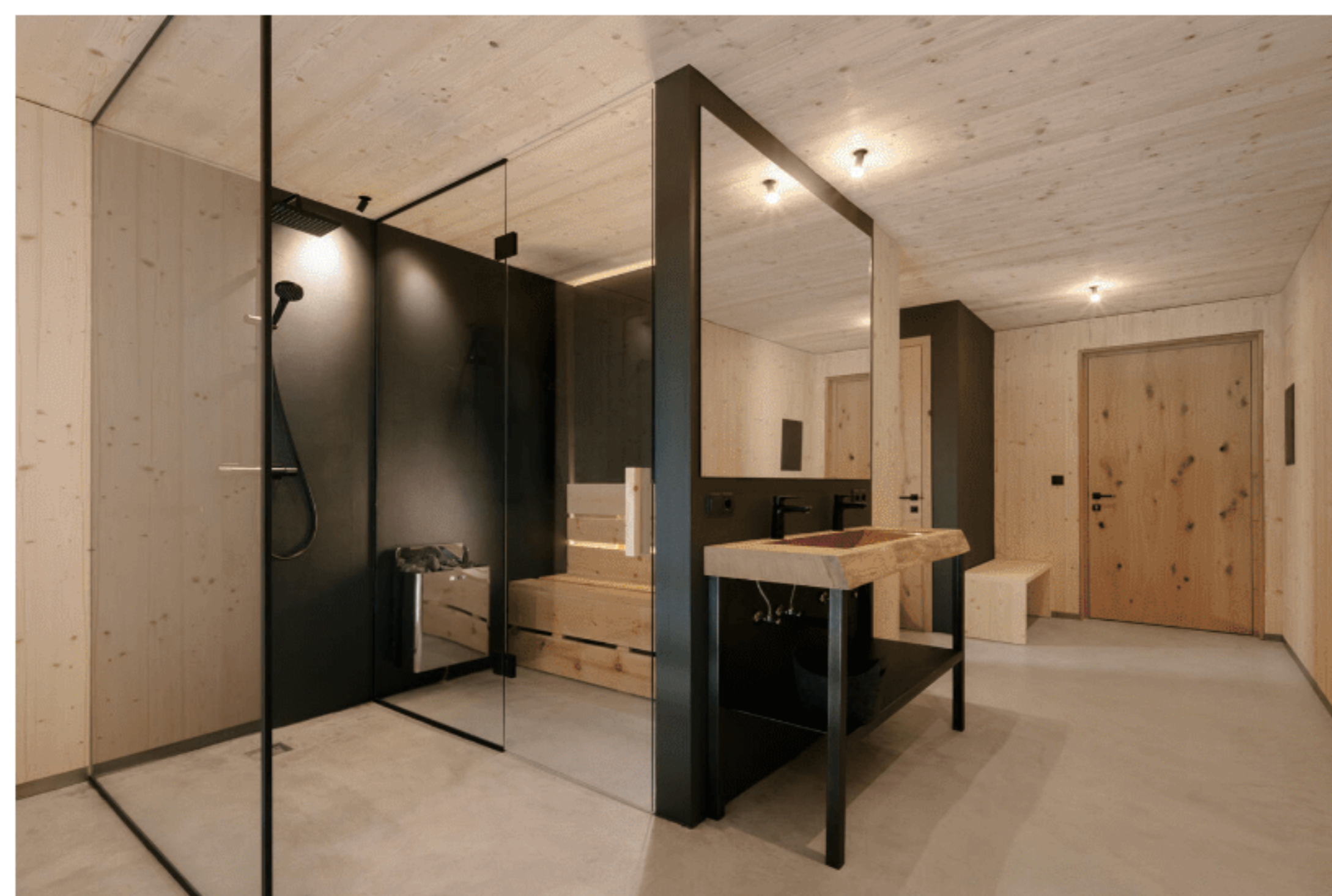
In der verglasten Sauna wartet Entspannung.

Die 65 Quadratmeter großen, puristischen Suiten gehen über zwei Stockwerke. Unten Wohnraum, Küche und Gartenzugang, oben Garderobe, Kleiderschrank, Bad, gemütliches Doppelbett und verglaste finnische Sauna. Dort relaxt du im Sommer nach dem Wandern und Biken und im Winter nach einem langen Skitag. Abschwimmen kannst du direkt beim Anders, das liegt nämlich genau neben der Piste.